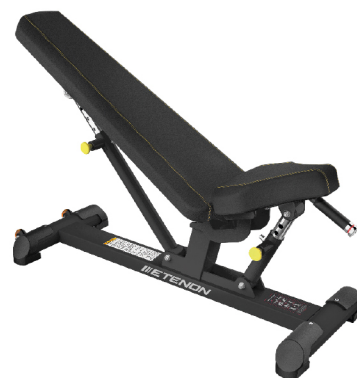
PTT0204 BANCO REGULABLE

DIMENSIONES: L: 122 x A: 86 x AL: 94 cm. PESO TOTAL: 50 kg.