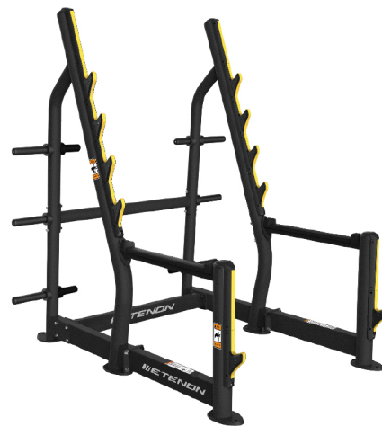
PTT0207 RACK DE SENTADILLAS DIMENSIONES: L: 186 x A: 165 x Al: 201 cm. PESO TOTAL: 145 kg.