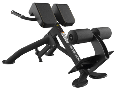
PTT0220 BANCO LUMBAR 45° DIMENSIONES: L: 142 x A: 82 x Al: 83 cm. PESO TOTAL: 42 kg.