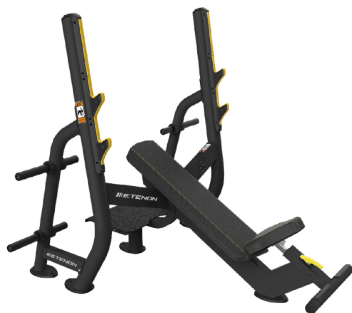
PTT0210 PRESS INCLINADO

DIMENSIONES: L: 134 x A: 45 x AL: 42 cm. (mín.) / 122 cm. (máx.). PESO TOTAL: 34 kg.