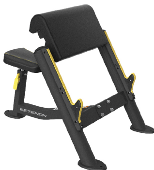
PTT0206 BANCO BÍCEPS

DIMENSIONES: L: 175 x A: 172 x AL: 136 cm. PESO TOTAL: 80 kg.