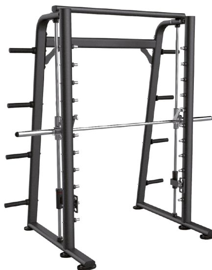
PC0920 MULTIPOWER DE DISCOS DIMENSIONES: L: 213 x A: 95 x Al: 212 cm. PESO TOTAL: 146 kg.