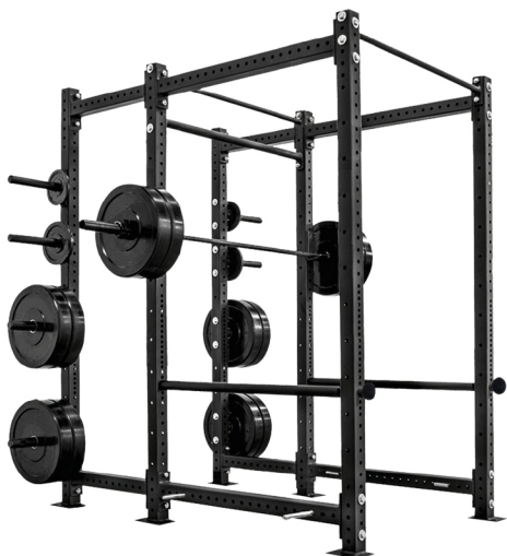
105311 JAULA DE SENTADILLA DIMENSIONES: L: 183 x A: 184 x Al: 228 cm. PESO TOTAL: 132 kg.