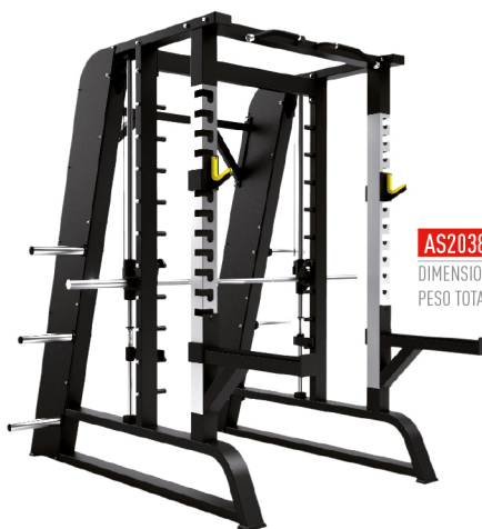
AS2038 MULTIPOWER / SENTADILLA DIMENSIONES: L: 224 x A: 219.5 x Al: 219 cm. PESO TOTAL: 258 kg.