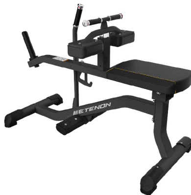
PTT0232 GEMELO SENTADO DIMENSIONES: L: 139 x A: 62 x Al: 94 cm. PESO TOTAL: 54 kg.