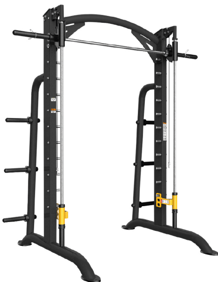
PTT0222 MULTIPOWER DE DISCOS DIMENSIONES: L: 217 x A: 158 x Al: 239 cm. PESO TOTAL: 198 kg. | Contrapesos que equilibran el peso de la barra.