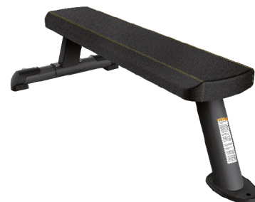
PTT0201 BANCO PLANO

DIMENSIONES: L: 174 x A: 138 x AL: 190 cm. PESO TOTAL: 114 kg.