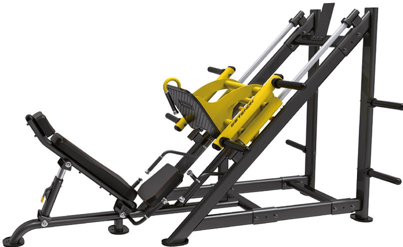
AS1737 PRENSA INCLINADA 45°

DIMENSIONES: L: 210 x A: 160 x Al: 156 cm. PESO TOTAL: 196 kg.