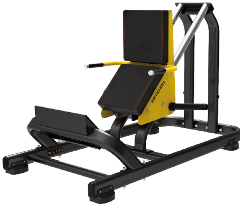
AS1706 GEMELO INCLINADO

DIMENSIONES: L: 158 x A: 148 x Al: 90 cm. PESO TOTAL: 86 kg.