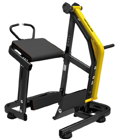
AS1710 PATADA DE GLÚTEO

DIMENSIONES: L: 256 x A: 151 x Al: 156 cm. PESO TOTAL: 267 kg.