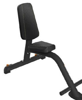
PTT0205 SILLA DE ENTRENAMIENTO

DIMENSIONES: L: 181 x A: 113 x AL: 120 cm. PESO TOTAL: 62 kg.