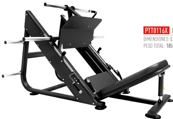
PTT0116X PRENSA DE DISCOS DIMENSIONES: L: 214.7 x A: 161.6 x Al: 143.7 cm. PESO TOTAL: 185 kg.