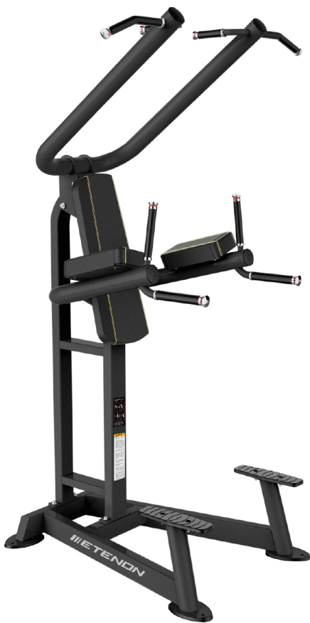
PTT0219 FONDOS | DOMINADAS | ABDOMINALES DIMENSIONES: L: 119 x A: 126 x Al: 230 cm. PESO TOTAL: 93 kg.