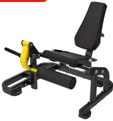
AS1711 EXTENSIÓN DE CUÁDRICEPS

DIMENSIONES: L: 136 x A: 137 x Al: 113 cm. PESO TOTAL: 102 kg.