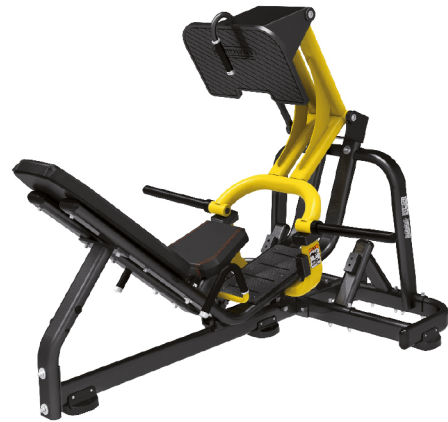
AS1705 PRENSA INCLINADA 45° PALANCA

DIMENSIONES: L: 186 x A: 106 x Al: 119 cm. PESO TOTAL: 130 kg.