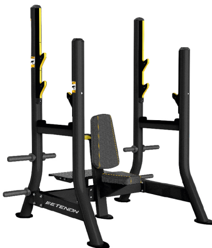
PTT0208 PRESS DE HOMBROS

DIMENSIONES: L: 177 x A: 172 x AL: 154 cm. PESO TOTAL: 115 kg.