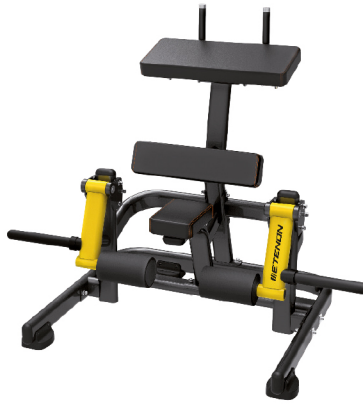
AS1714 FEMORAL DE PIE

DIMENSIONES: L: 136 x A: 137 x Al: 113 cm. PESO TOTAL: 102 kg.