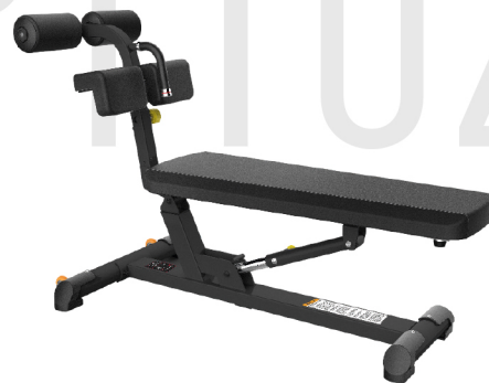
PTT0218 BANCO ABDOMINAL 90° DIMENSIONES: L: 158 x A: 72 x Al: 98 cm. PESO TOTAL: 43 kg.