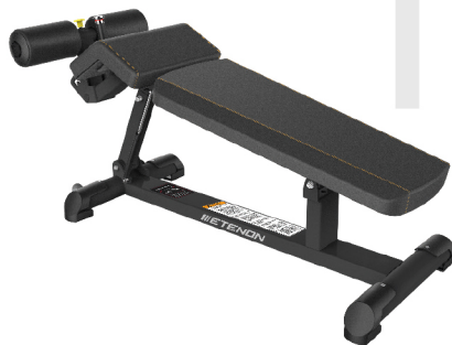
PTT0228 BANCO REGULABLE DECLINADO DIMENSIONES: L: 143 x A: 56 x Al: 62 cm. (mín.) / 96 cm. (máx.). PESO TOTAL: 47 kg.