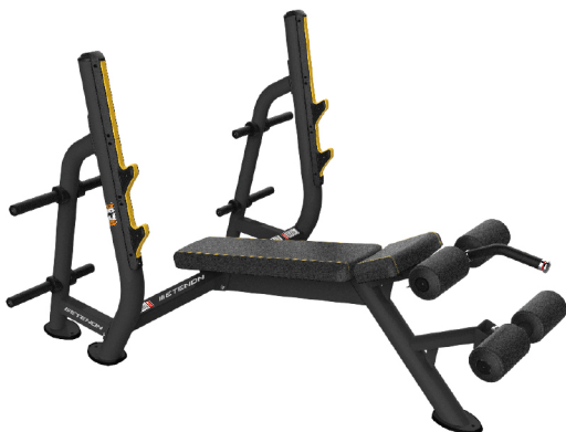
PTT0211 PRESS DECLINADO

DIMENSIONES: L: 56 x A: 39 x AL: 37 cm. PESO TOTAL: 18 kg.