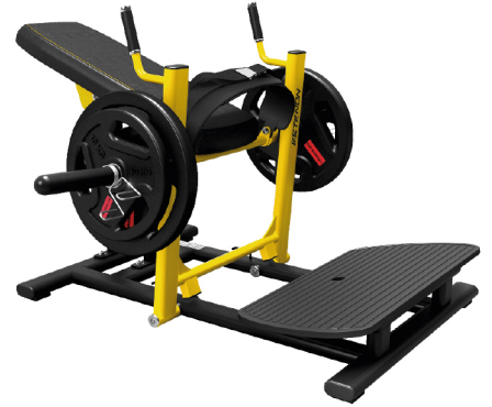
AS1716 GLUTE DRIVE

DIMENSIONES: L: 123 x A: 163 x Al: 139 cm. PESO TOTAL: 120 kg.