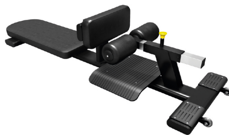
XH003 BANCO SISSY / ABS DIMENSIONES: L: 198 x A: 63 x Al: 40.5 cm. PESO TOTAL: 50 kg.