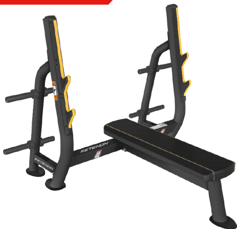
PTT0209 PRESS HORIZONTAL

DIMENSIONES: L: 175 x A: 172 x AL: 136 cm. PESO TOTAL: 80 kg.