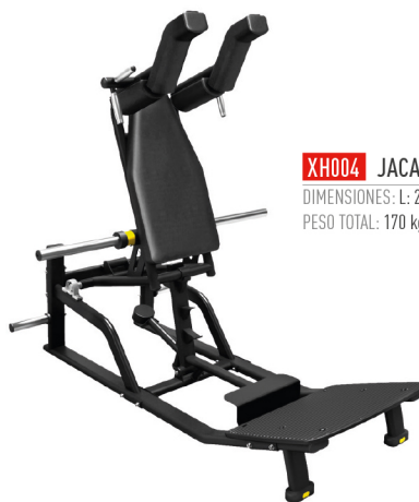
XH004 JACA DE DISCOS DIMENSIONES: L: 205 x A: 143 x Al: 175 cm. PESO TOTAL: 170 kg.