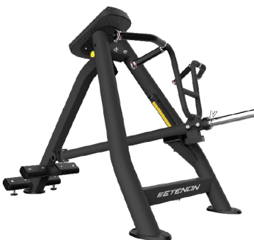
PTT0231 REMO EN PUNTA

DIMENSIONES: L: 207 x A: 172 x AL: 136 cm. PESO TOTAL: 96 kg.